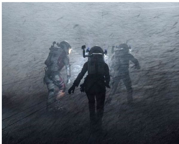
Момент пылевой бури в фильме

Указание: Типичная скорость ветра в марсианской буре – 100 м/с. Марсианская атмосфера состоит практически из чистого углекислого газа, давление у поверхности составляет 600 Па, средняя молярная масса земной атмосферы – 29 г/моль, давление у земной поверхности – 101 кПа, температуру у поверхности планет считать одинаковой, газ – идеальным. Сила сопротивления пропорциональна плотности газа и квадрату его скорости.